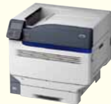
ホワイトトナー対応プリンター MICROLINE VINCI C941dn